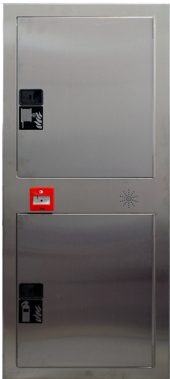
Ref. M002886 ARMARIO* Ref. M002680 PREMARCO*