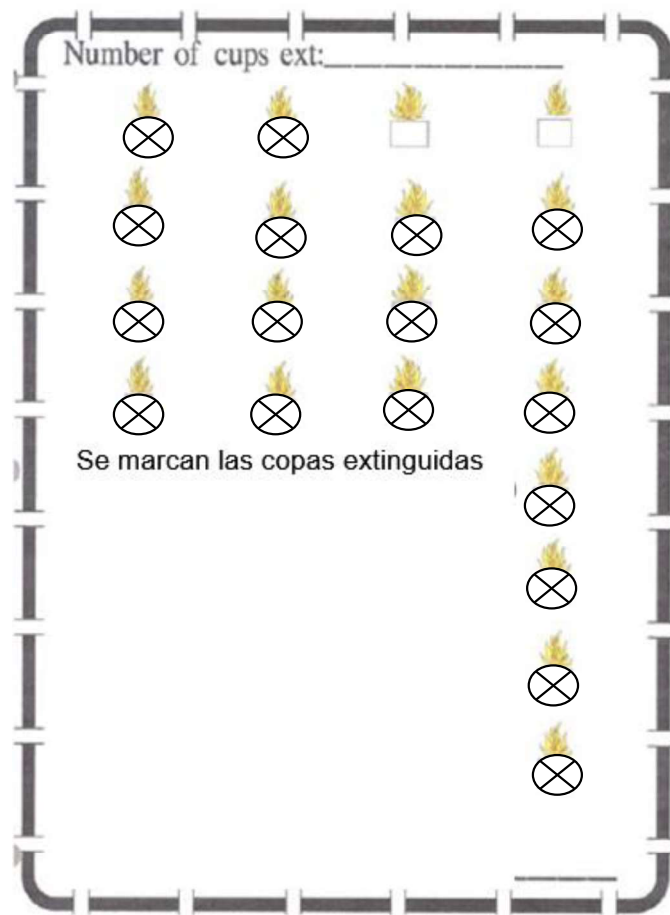
Fig. 3 Ensayo 2. 18 Copas extinguidas