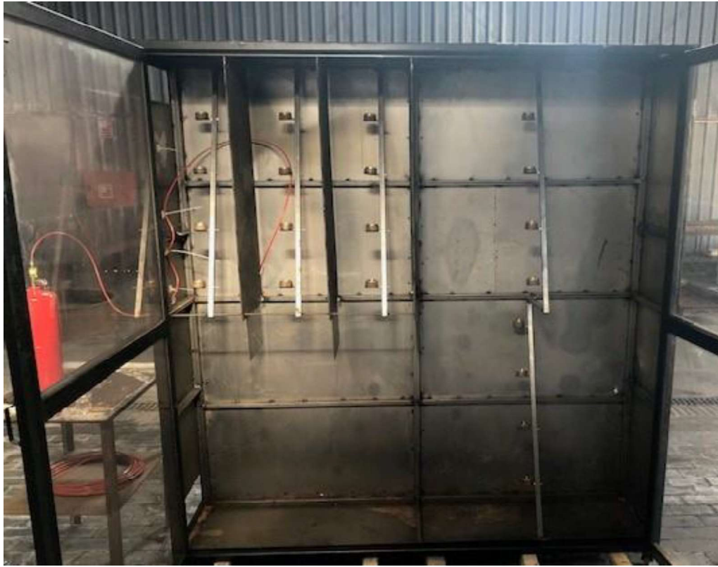
Fig.5 Vista general