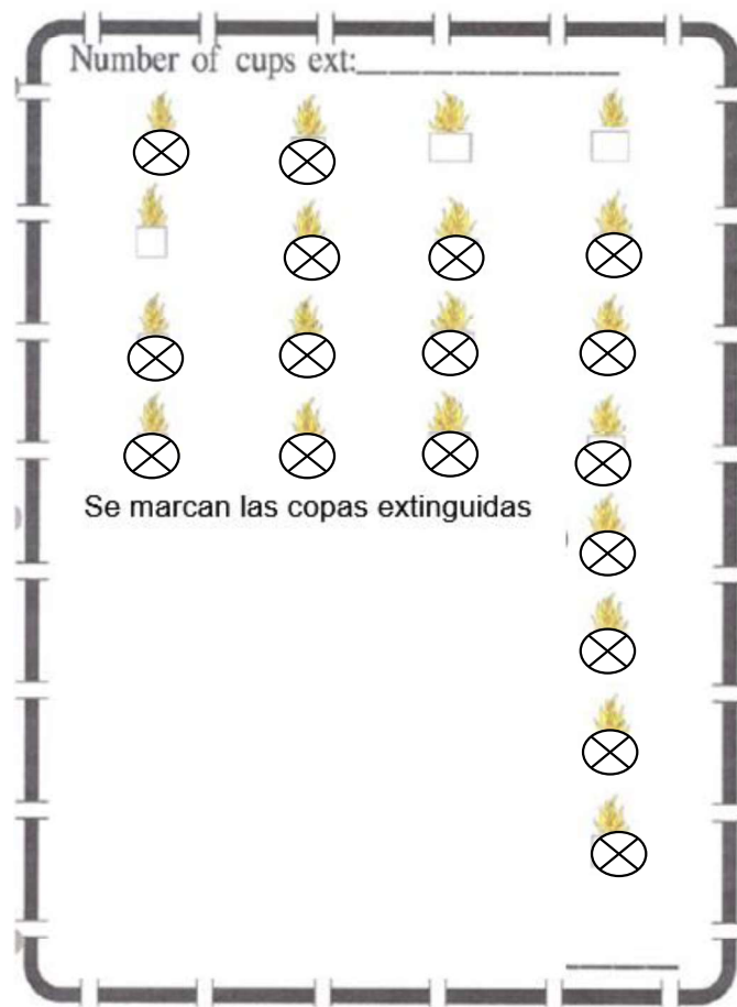
Fig. 4 Ensayo 3. 17 Copas extinguidas