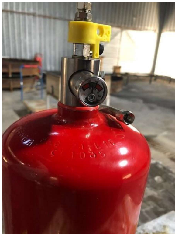
Fig. 6 Detalle válvula