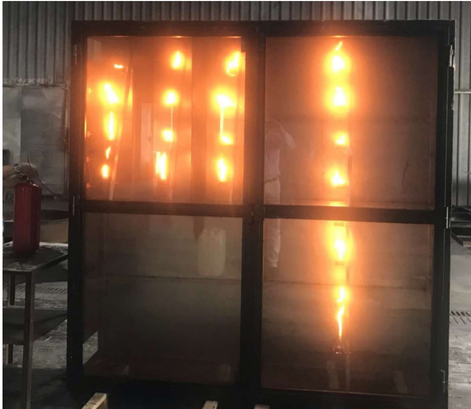
Fig. 7 Combustión de las copas previa a a la extinción.