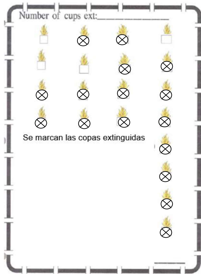
Fig. 2 Ensayo 1. 16 Copas extinguidas