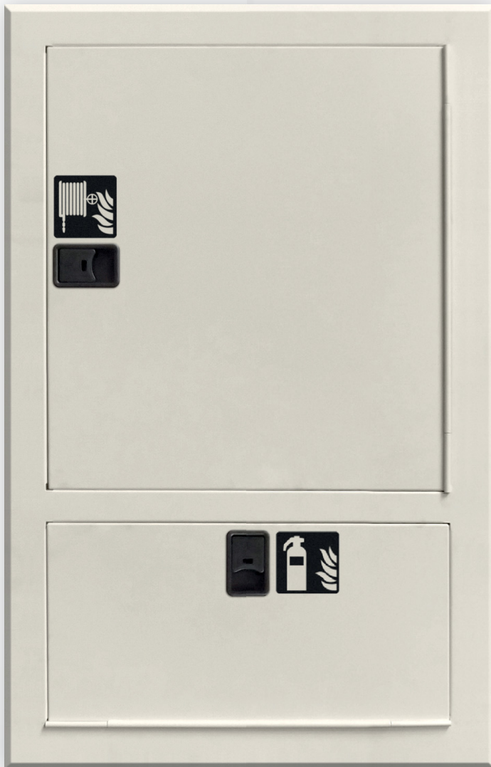
Ref. M010133+ M010134*