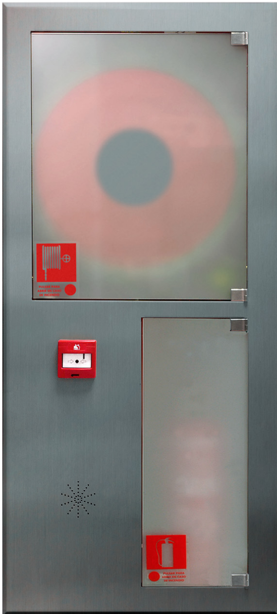
Ref. M002866 ARMARIO* Ref. M002867 PREMARCO*